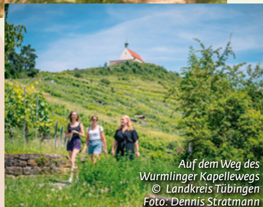
Auf dem Weg des Wurmlinger Kapellewegs