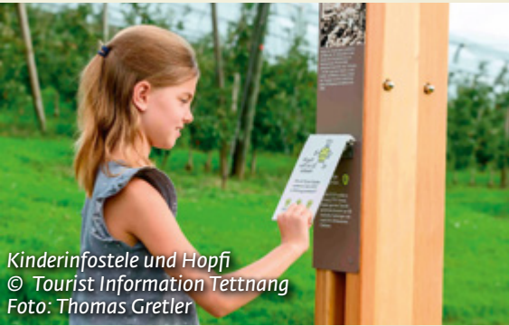
Kinderinfostele und Hopfi