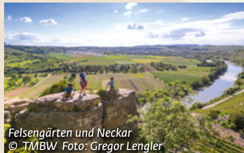
Felsengärten und Neckar