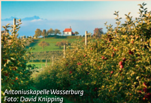
Antoniuskapelle Wasserburg

Mehr Infos: www.echt-bodensee.de/aktiv-genießen/wandern/genusstouren