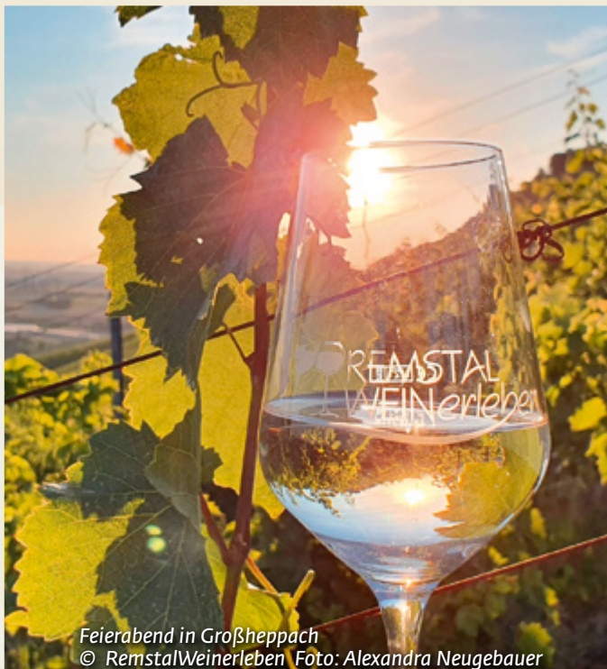
Feierabend in Großheppach

Infos: https://remstal.de/natur/wandern/genusswandern