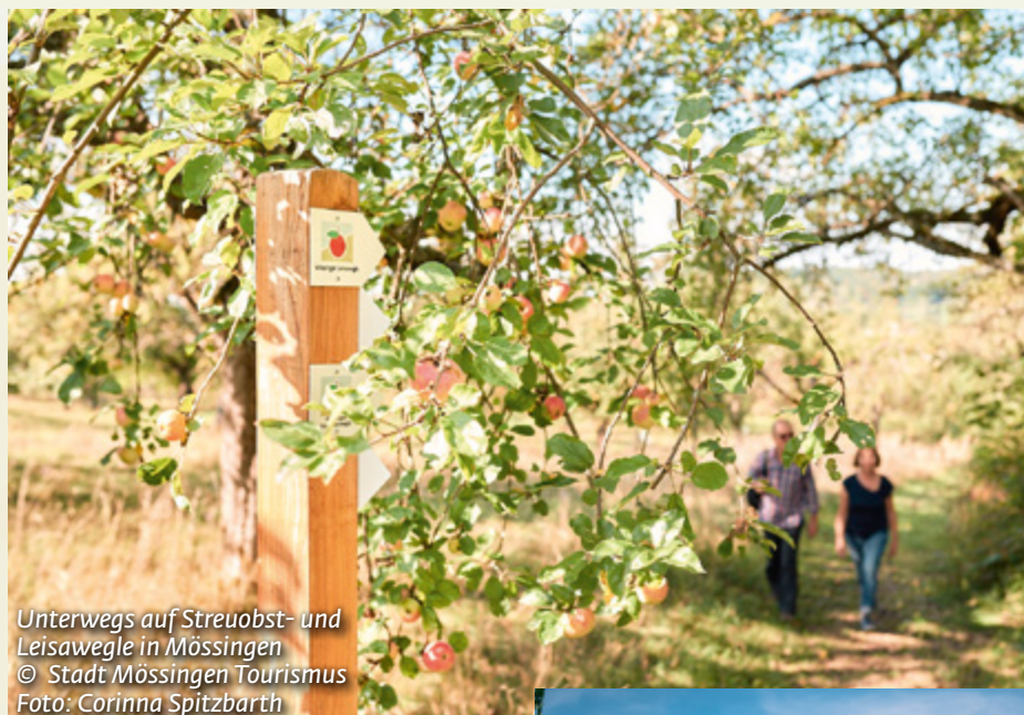
Unterwegs auf Streuobst- und Leisawegle in Mössingen