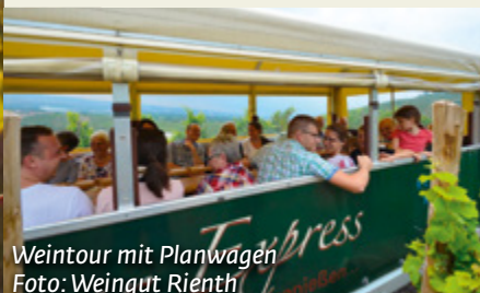
Weintour mit Planwagen