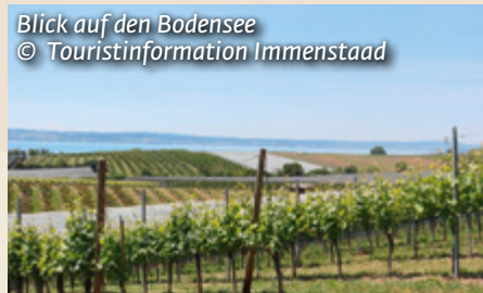
Blick auf den Bodensee